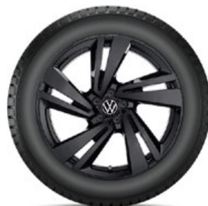
VW Nevada Schwarz

Alle Preise auf dieser Seite sind unverb., nicht kart. Richtpreise in Euro inkl. MwSt. exkl. Einbau/Montage.