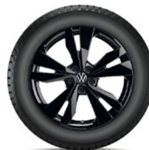
VW Loen Schwarz