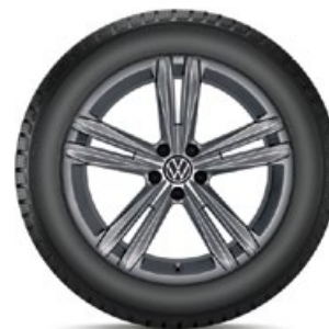
VW Sebring Grau