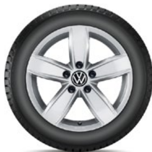
VW Corvara Silber