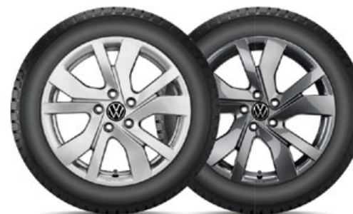
VW Rockingham Silber

VW Huntsville Silber für den neuen Tiguan in 19" mit 235/50 R19 103V XL Bridgestone Blizzak LM005 statt 3.600,- mit TopCard 2.700,- KE: C | NHK: A | GE: 72 | GE/G: B | SK-F: Nein Art.-Nr. 2355019HV40005