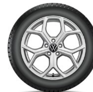
VW Huntsville Silber

Alle abgebildeten Winterkomplettäder (WKR) für den neuen Tiguan haben keine Reifendruckkontroll-Sensoren (RDKS). Falls Ihre Fahrzeugausstattung dies erfordert, sind WKR mit RDKS zu wählen. Beachten Sie bitte den Aufpreis. Ihr Volkswagen Service-Betrieb informiert Sie gerne.