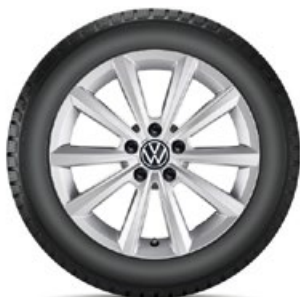
VW Merano Silber

1 Für Fahrzeuge mit Ausstattung „direkt messendes Reifendruckkontroll-System RDKS“